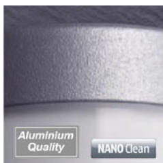
Hochwertige Materialien und schmutzabweisende Nano-Beschichtung

Unabhängig von der Dämmerungsautomatik des LED-Panels wird die Hauptleuchte mit den leistungsstarken G9-Leuchtmitteln bewegungsabhängig eingeschaltet. Dabei entspricht die Sensortechnik der styLED Edition dem innovativen Innenleben der Erfolgsleuchte L 270 S. Der prozessorgesteuerte Hightech-Mini-Sensor ermöglicht bei kleinster Baugröße eine hochauflösende, gleichmäßige Erfassung bis zu einer Entfernung von 8 m im kompletten 360° Umkreis. Egal, aus welcher Richtung man kommt – von der Garage, von der Straße, aus dem Garten oder auch aus der Haustür: Das Halogenlicht der Leuchte wird bei Annäherung sicher eingeschaltet.