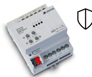
DIM4 KNX-S 4-ch Dimming Actuator EAN 4007841 089191