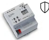
DALI128 KNX-S 2-ch DALI-Gateway EAN 4007841 089214