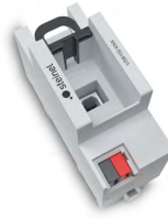
USB100 KNX USB Interface EAN 4007841 085674