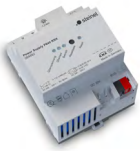
P640 KNX Power Supply 640mA EAN 4007841 084882