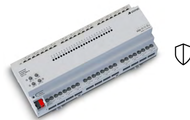
UA24 KNX-S 24/12-ch Universal Actuator EAN 4007841 089184