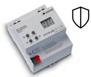
DALI64 KNX-S 1-ch DALI-Gateway EAN 4007841 089207