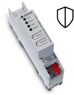
ALC100 KNX-S Area/Line Coupler EAN 4007841 085643