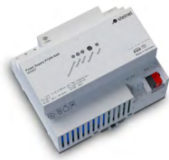
P1280 KNX Power Supply 1280mA EAN 4007841 085667