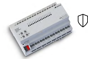
UA16 KNX-S 16/8-ch Universal Actuator EAN 4007841 089177