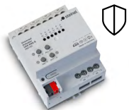
UA6 KNX-S 6/3-ch Universal Actuator EAN 4007841 089160