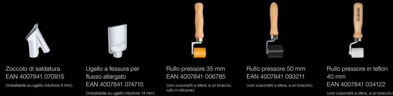
Zoccolo di saldatura EAN 4007841 070915 (Installabile su ugello riduttore 9 mm)