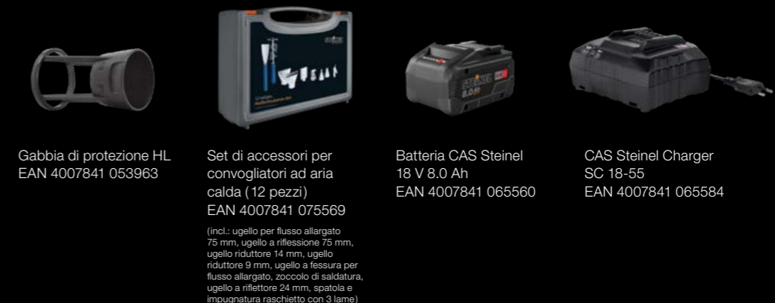
Gabbia di protezione HL EAN 4007841 053963