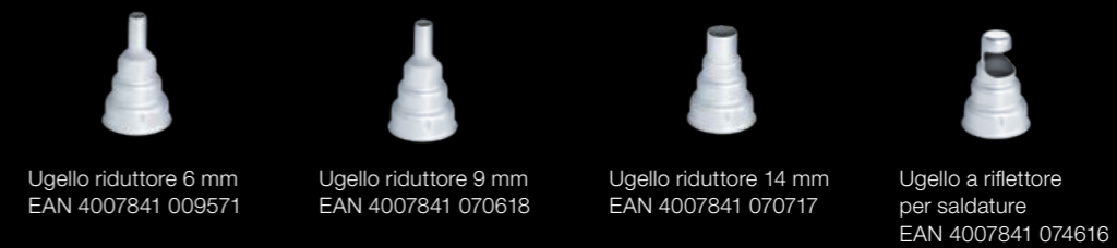
Ugello riduttore 6 mm EAN 4007841 009571