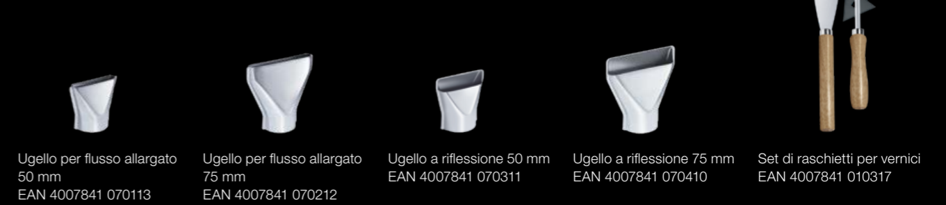
Ugello per flusso allargato 50 mm EAN 4007841 070113