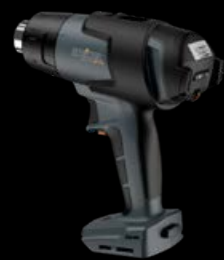
Apparecchio senza batteria

Il compatto mobile heat MH5 offre quattro programmi specifici in funzione dell'applicazione e fornisce aria calda in tempo record. La fase di riscaldamento richiede meno di quattro secondi. Già dopo 20 secondi si raggiungono i 500 °C. La temperatura può essere impostata digitalmente tra 50 °C e 500 °C in step da 10 °C in base alle necessità e con la massima precisione. Inoltre il volume d'aria è regolabile digitalmente su sei livelli (fino a 300 l/min). Attraverso il display si tengono sempre sotto controllo temperatura e volume d'aria. Grazie alla potente batteria CAS da 18 V sono possibili impieghi flessibili facendo a meno del cavo – ideale per esempio per interventi di riparazione a teloni di camion o per la rapida saldatura di membrane per la copertura di tetti.