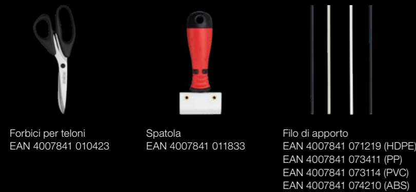
Forbici per teloni EAN 4007841 010423