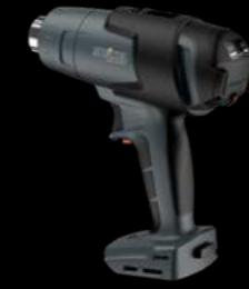
Apparecchio senza batteria

Rapidamente a portata di mano e pronto all'azione: il convogliatore ad aria calda a batteria da 18 V mobile heat MH3 è pronto per l'uso entro cinque secondi e, con 300 °C e 500 °C, offre due livelli di temperatura direttamente impostabili sul joystick. Il potente apparecchio è predisposto per volumi d'aria fino a 200 l/min. Con una carica della batteria si possono eseguire con precisione e sicurezza fino a 200 calettamenti di qualsiasi tipo. Grazie alla lampadina LED integrata l'area di lavoro è sempre illuminata in modo ottimale.