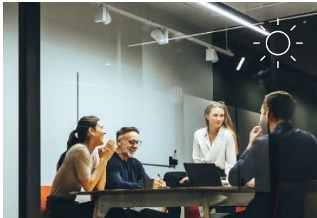
Verbesserung der Lichtsteuerung