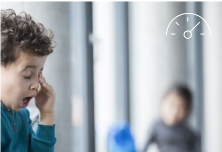
Feintuning der Lüftung