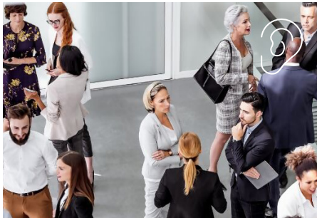
Analyse des Lärmpegels