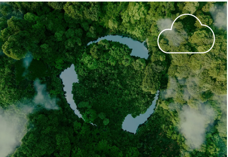
Hohe CO 2 -Einsparung