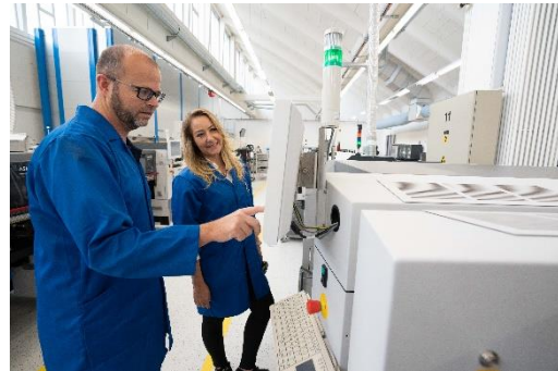
Bild 2 Ein SMD-Kopf bei der Bestückung von Leiterplatten (Bild: STEINEL Solutions AG).